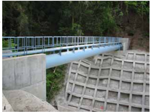
【完成したばかりの新しい水路橋】