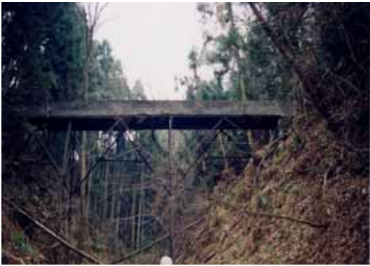
【平成30年頃造成された古い水路橋】