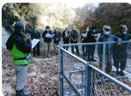
新しくなった深沢川頭首工