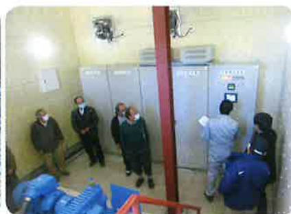
大間々用水神梅発電所内部

昨年の12月8日と9日の2日間を使って役員と総代さんとの合同研修会を開催しました。