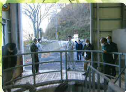
渡良瀬川揚水機場ポンプ室