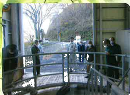
渡良瀬川揚水機場ポンプ室