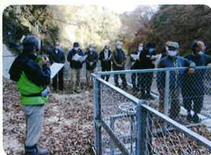
新しくなった深沢川頭首工