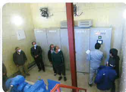
大間々用水神梅発電所内部

昨年の12月8日と9日の2日間を使って役員と総代さんとの合同研修会を開催しました。