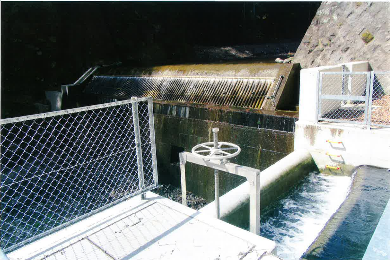
～令和 2 年度改修工事が終了し新しくなった深沢頭首工～

〒376-0101 群馬県みどり市大間々町大間々 1549 TEL.(0277) 73 - 5599