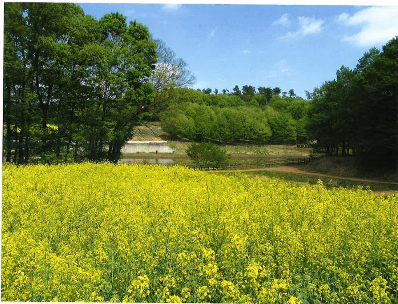
春の清水新沼(調整池)風景