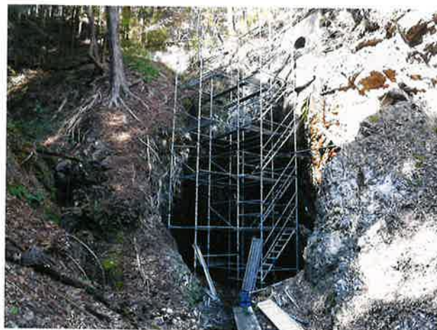
8号隧道出口改修工事中の状況(平成29年度)

頭首工（左岸側）1式、護床ブロック製作 1式 測量設計費 1式、用地費及び補償費 1式