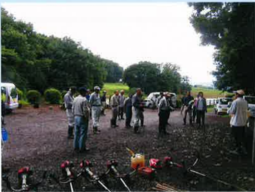
作業の説明を聞く参加者のみなさん

大間々用水土地改良区はNPO鹿田山環境保全ネットワークの活動組織の一員として、6月～10月の毎月第1土曜・午前8時～10時の約2時間行われる鹿田山クリーン大作戦（草刈り・清掃作業）に参加しています。今年最初の大作戦決行日は 6月1日(土) です。